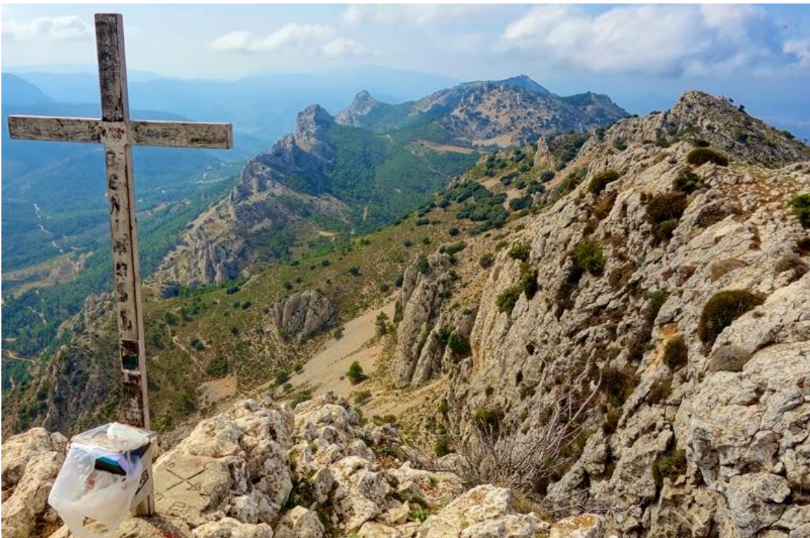
Cima del Pla de la Casa

Inscripción y bajas (antes del viernes anterior a la actividad, rellenad el siguiente formulario: https://goo.gl/forms/PeKj9bUBFnx0iY5X2