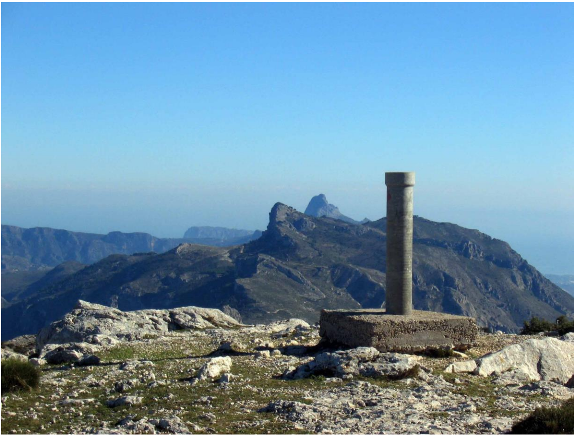
Cima de la Mallá del Llop