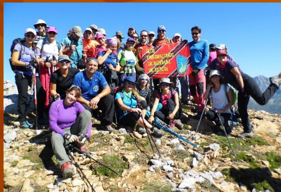
Campamento Nacional Montaña, Posada Valdeón.

El CUMM colabora con la Universidad de Murcia, ofreciendo precios especiales a sus estudiantes y trabajadores.