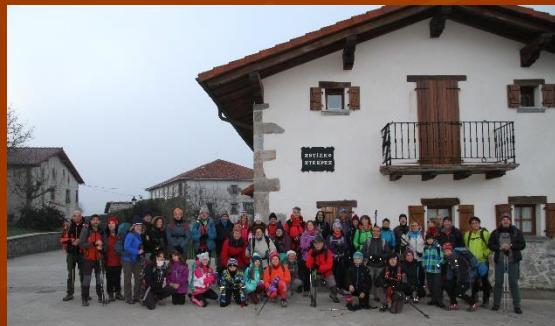
Nochevieja 2018 en la Sierra de Aralar, Astitz.