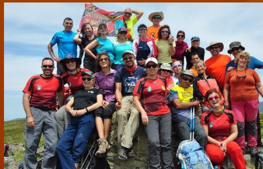
Pico Moncalvo, 2044m., Sanabria