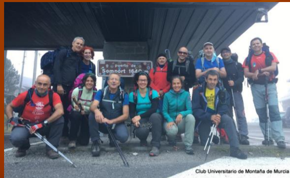
Senda de Camille, Pirineos