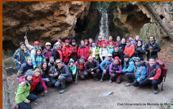
Cañón del río Val, Ágreda, Soria

El CUMM colabora con la Universidad de Murcia, ofreciendo precios especiales a sus estudiantes y trabajadores.