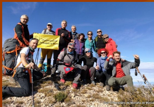
Travesía del Montsant, Tarragona