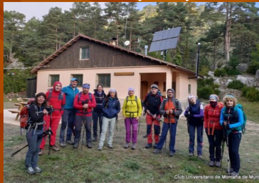
Puertos de Beceite, Teruel, Castellón

El CUMM colabora con la Universidad de Murcia, ofreciendo precios especiales a sus estudiantes y trabajadores.